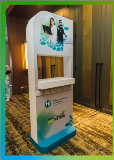
Logo en cargadores de torre