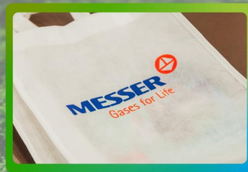
Logo a dos tintas en bolsos para los asistentes