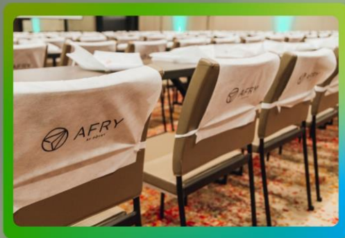
Logo a una tinta en espaldares