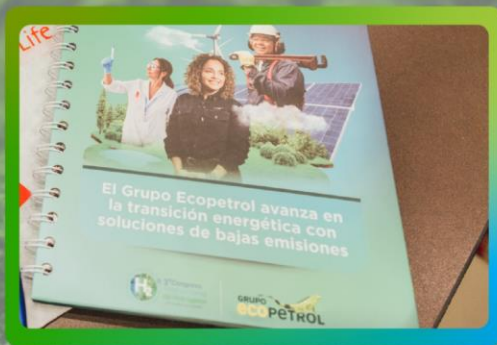
Logo en cuadernos para asistentes