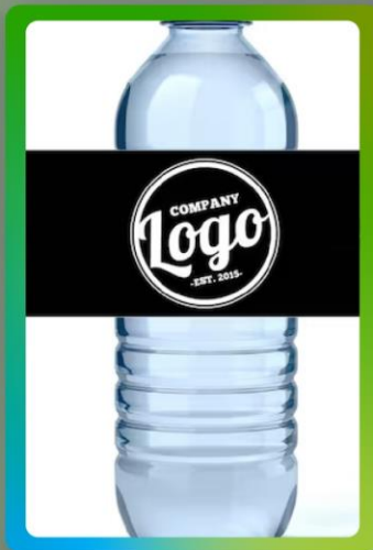
Logo en botellas de agua