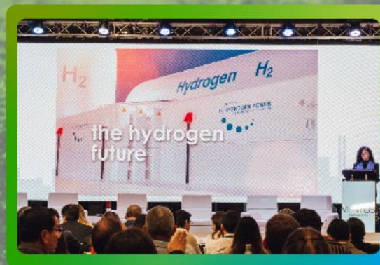
Video corporativo de un minuto