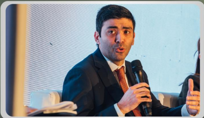
Nicolas Barguil Representante a la Cámara Comisión Quinta Cámara de Representantes