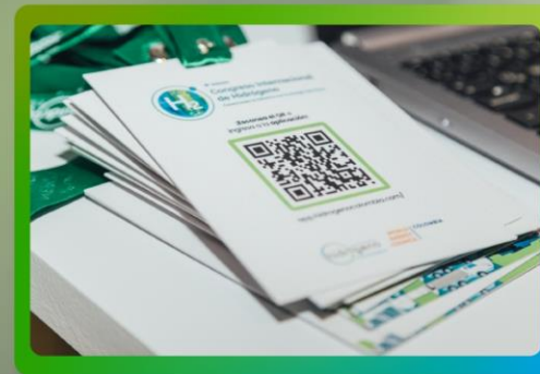
Logo en escarapela de identificación