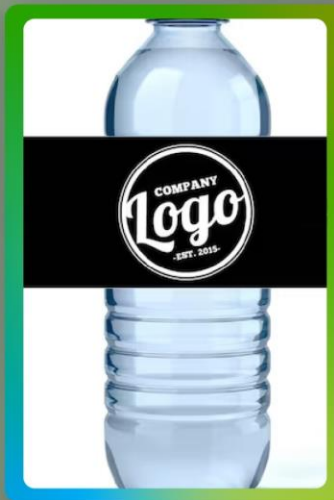
Logo en botellas de agua