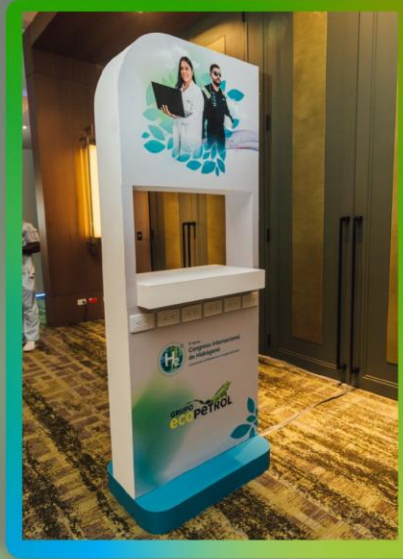
Logo en cargadores de torre