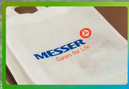
Logo a dos tintas en bolsos para los asistentes