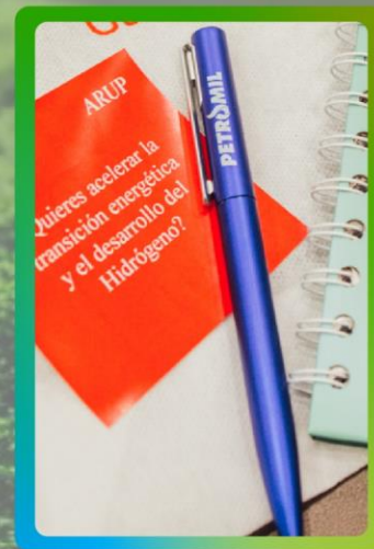
Logo a una tinta en lapicero para asistentes