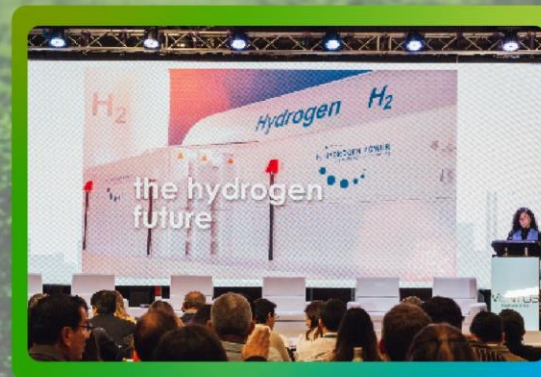
Video corporativo de un minuto