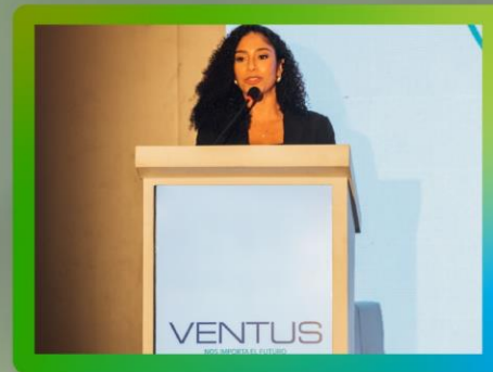
Logo en atril digital de tarima principal