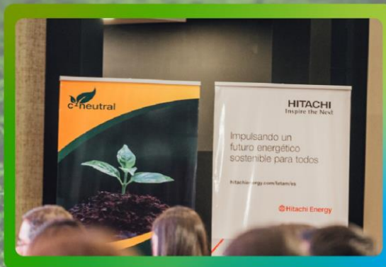
Pendón Rollup en el evento académico