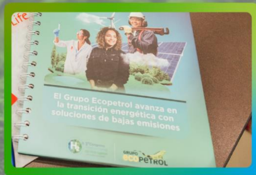
Logo en cuadernos para asistentes