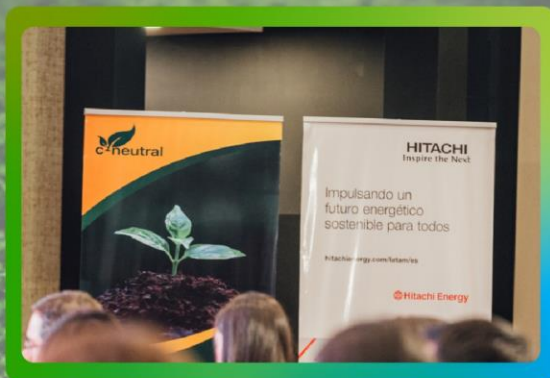
Pendón Rollup en el evento académico