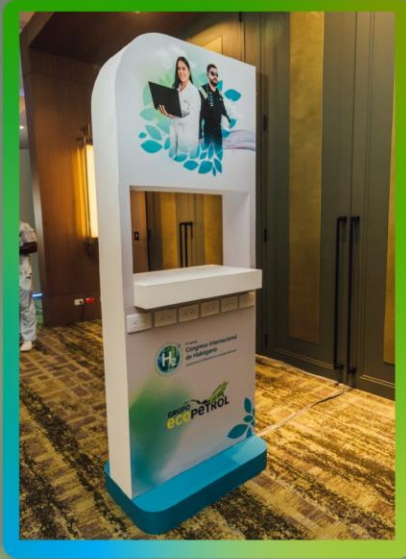
Logo en cargadores de torre